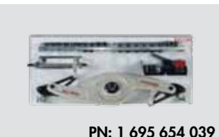
PN: 1 695 654 039