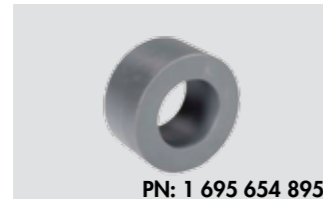
PN: 1 695 654 895