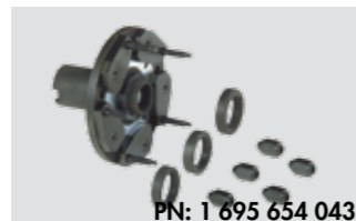
PN: 1 695 654 043