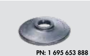
PN: 1 695 653 888