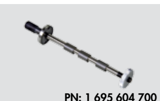
PN: 1 695 604 700