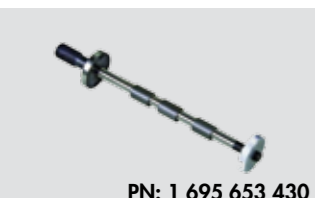
PN: 1 695 653 430