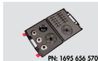
PN: 1695 656 570