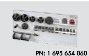
PN: 1 695 654 060