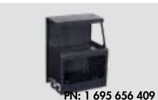
PN: 1 695 656 409