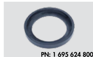
PN: 1 695 624 800